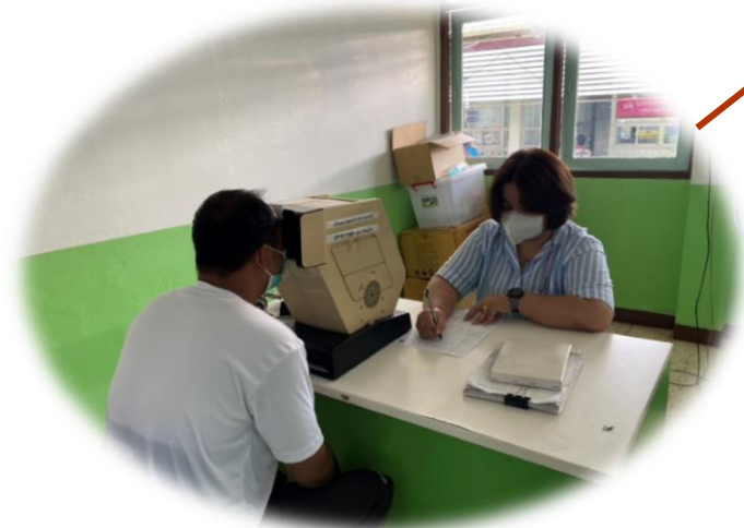
สมรรถภาพการมองเห็น