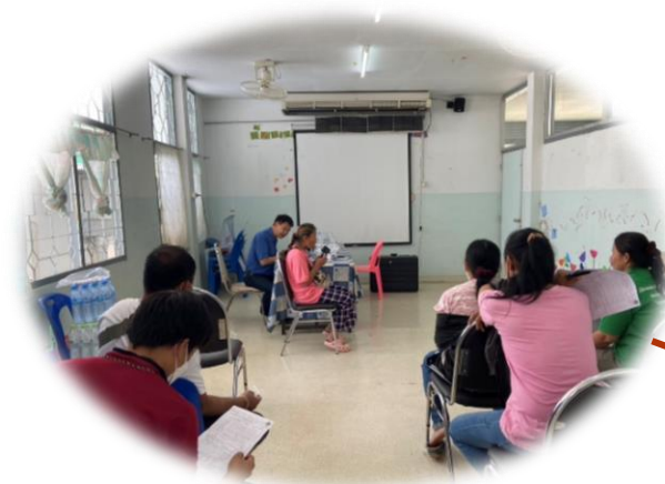
สมรรถภาพปอด