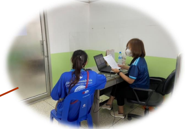
สมรรถภาพการได้ยิน