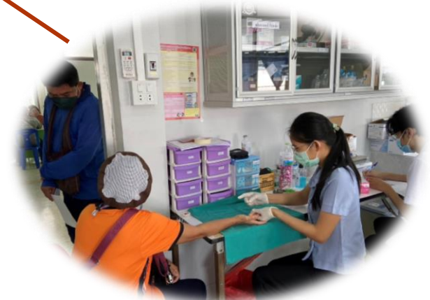
เพิ่มเติม : ตรวจหาสารเคมีตกค้างในกระแสเลือด